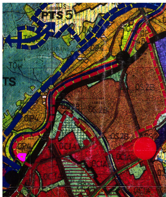
WYRYS ZE STUDIUM UWARUNKOWAŃ I KIERUNKÓW ZAGOSPODAROWANIA PRZESTRZENNEGO MIASTA ZAKOPANE